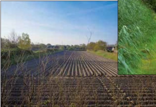
Perceel met vroege aardappelen, beschut tussen de zandwallen.