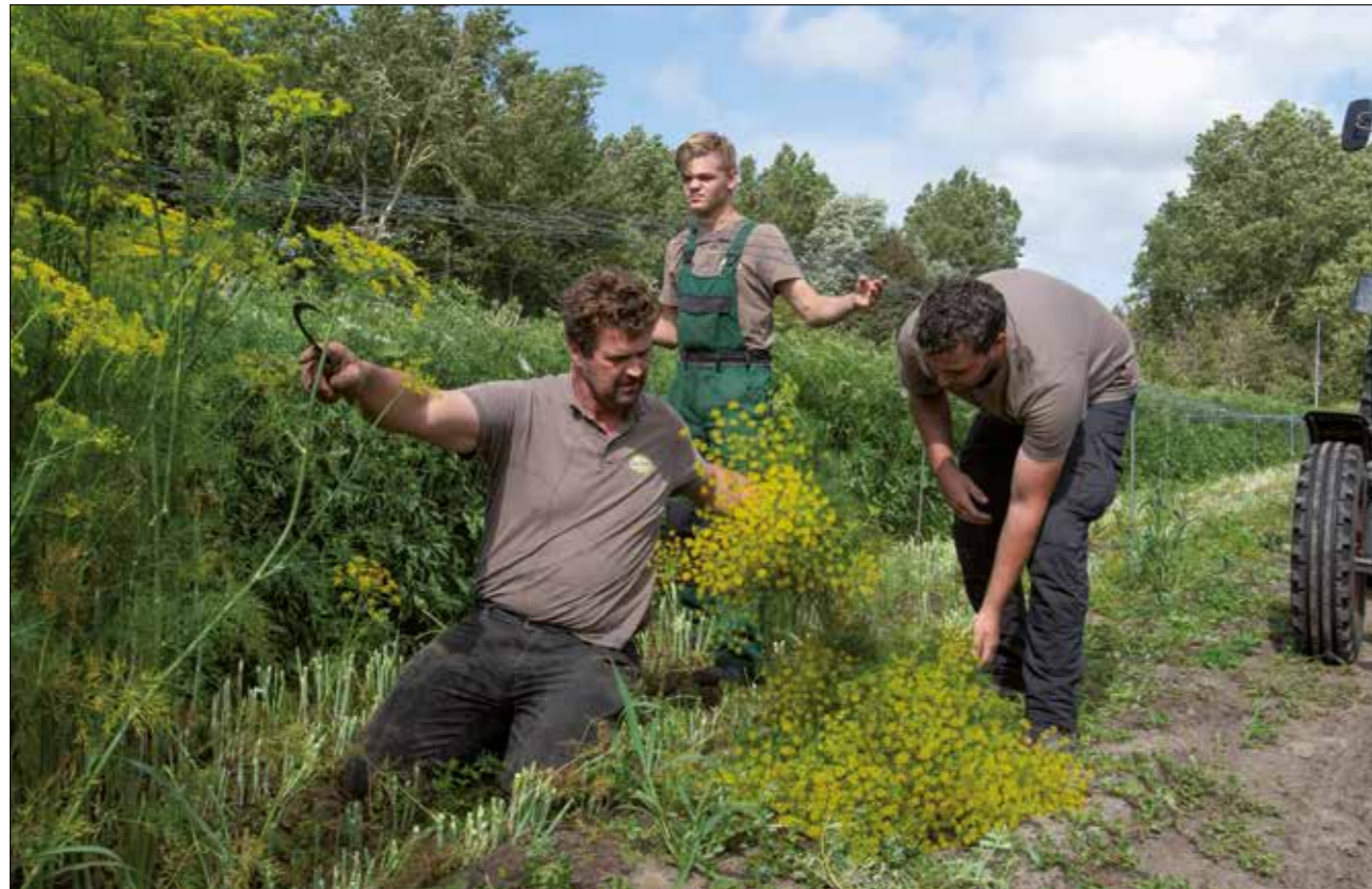
De oogst van dille. Dille groeit heel goed in de beschutting van zandwallen.

Het onderhoud van zandwallen luistert nauw. Rijke grond, gebiedsvreemde beplanting, een hap eruit met een laadschop: een aantasting is zo gebeurd en de schade is vaak niet meer te herstellen. De vermenging van de oorspronkelijke arme grond met nieuwe voedselrijke grond zorgt voor een bijna onomkeerbare verandering van structuur en vegetatie.