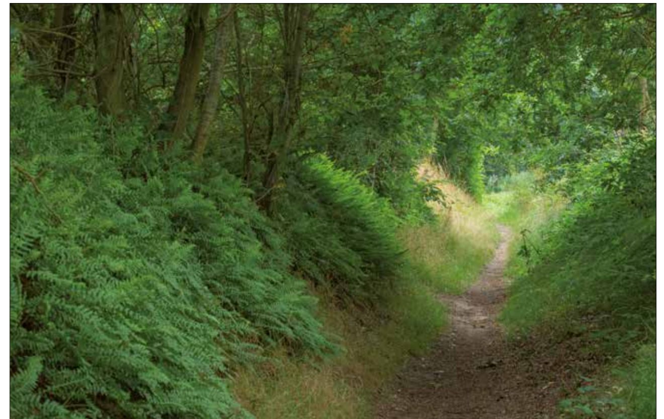
Het Mannenpad, met eikvaren op de zandwallen.

Schurvelingen en zandwallen bestaan van oudsher uit arme grond, duinzand. Hierop groeiden planten die bestand waren tegen de droogte, de wind en het gebrek aan voeding. De vegetatie op de zandwallen werd vaak kort gehouden door begrazing met een geit. Later groeiden er ook houtachtige soorten op de zandwal zoals meidoorn en hier en daar een eik. Aan de noord- en oostkant van de wallen kwam soms eikvaren op.