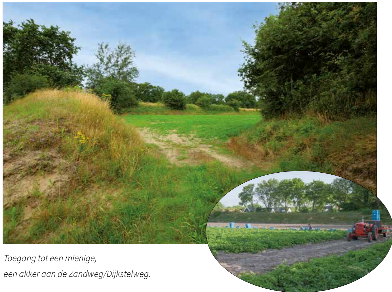
Toegang tot een mienige, een akker aan de Zandweg/Dijkstelweg.

Zandwallen en de kamers ertussen vertellen in een oogopslag de landschappelijke geschiedenis van de kop van Goeree. Ze vertellen over het bestaan van de boeren in een haast vijandige omgeving, van de middeleeuwen tot aan vandaag.