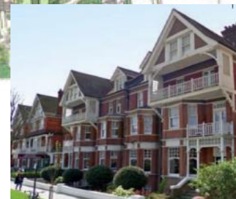
Bebouwing bij cijfer 4