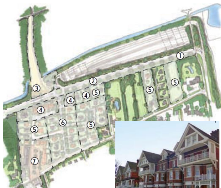
Plan Ouddorp Bad Oost

c. In Ouddorp Bad Oost (bij het Fletcher Hotel) willen we vooral dat de plannen veel minder grootschalig worden. In de eerdere plannen was sprake van rond de 100 eenheden voor recreatie en permanente bewoning. Vooral het hotel langs de Vrijheidsweg met 4 bouwlagen was ons een doorn in het oog. De plannen liggen nu al jaren stil en het is onduidelijk hoe dit verder zal gaan. We houden natuurlijk de vinger aan de pols.